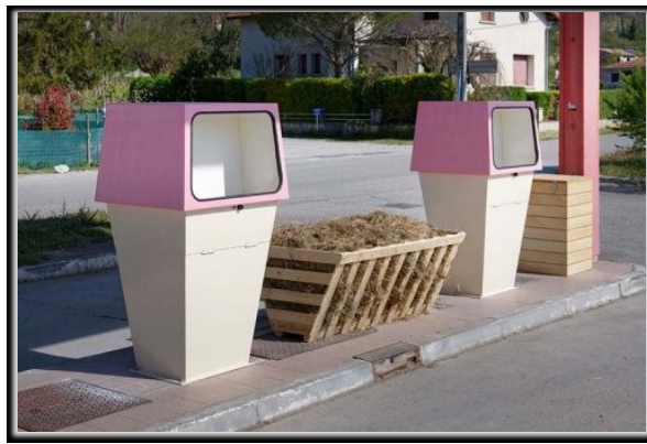
François Curlet — Cheval vapeur Vercheny 2021

Les commerçants de quartier prolifèrent avec l'hydrocarbure également, villes, réseau routier et campagnes sont bornés.