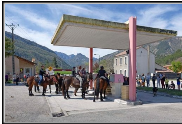
François Curlet — Cheval vapeur Vercheny 2021

Tout commerce d'envergure englobe la chaîne complète de la production à la distribution, les stations-services indépendantes passent à la moulinette des groupes de la grande distribution.